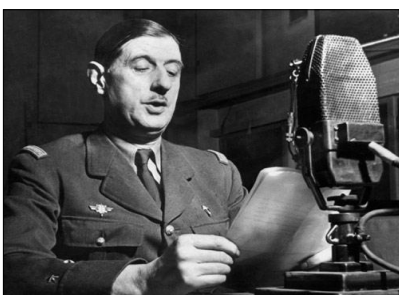
18 juin 1940 le Général De Gaulle demande à tous les Français de venir le rejoindre à Londres pour résister aux Allemands.

6- Qui sont les auteurs de ce chant? Quels liens ont-ils avec la résistance ? Anna Marly a créé ce chant ; Kessel et Druon l'ont traduit en français. Ce sont des personnes engagées dans la résistance.